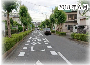
路面に注意喚起表示が施されました。

入間市内には、4カ所の事故危険箇所、2カ所の対策が必要な区間として、国土交通省や埼玉県から整備を求められた道路がありますが、入間市道は含まれていません。私たちがの生活に身近な市道を含めた事故危険箇所の整備を進めるため、みなさまの声をもとに調査を行い、今年の6月に扇台一丁目16番地先交差点の改修を行うことができました。また、同様箇所の調査推進を議会でも取り上げ交通安全施設等の整備推進を訴えました。