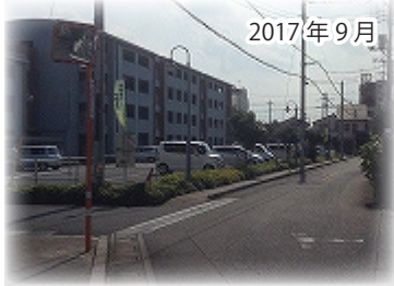
カーブミラーを設置しました